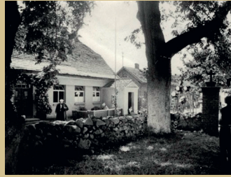
Dreharbeiten zu „Altes Herz geht auf die Reise“ an der Carwitzer Kirche

1945 wurde „Altes Herz geht auf die Reise“ von den Alliierten gefunden und erlebte 1947 in Los Angeles seine Uraufführung. In der Bundesrepublik war er erstmals 1974 zu sehen.